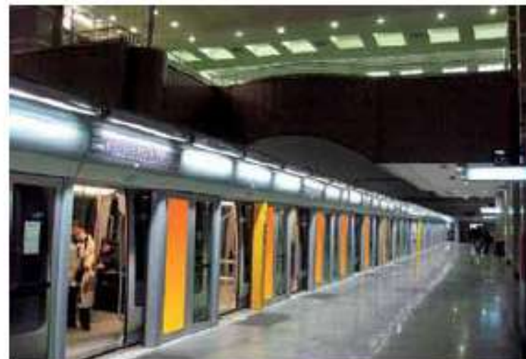
Tram linea 4